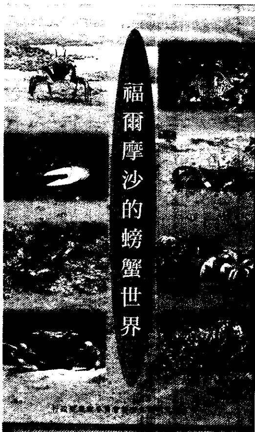
教育館播放珍貴的螃蟹生態記錄片

由集集鎮合平里獅鼓陣表演，活潑逗趣的獅陣，配合咚咚鼓聲，鼓舞著在場每一位來賓的心情，也為災後的集集注入新生，集集災區救災大家長農委會