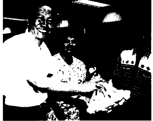
筆者（左一）看到這稀奇的蒜頭王比賽，忍不住也要求能與得獎的蒜頭王合影留念