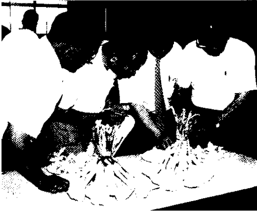
經專家學者公正評選裁判選出最優的「特等獎」