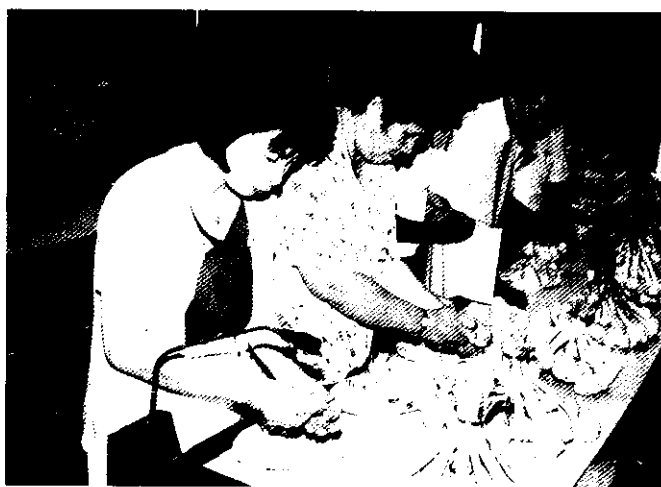
工作人員把捆綁的蒜頭蒜瓣剝開看其數量