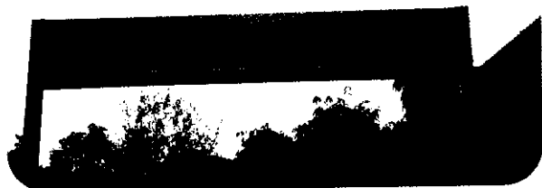
太平市農會輔導之東平市民農園

有鑑於此，第二處市民農園應運而生，位於東平里中和路的東平市民農園面積約8.6分地，園內規劃分爲農業體驗園區、休閒服務與公共設施區；農業體驗園區面積800坪，1年租金4,000元，水電費及押金另計1,500元，總計