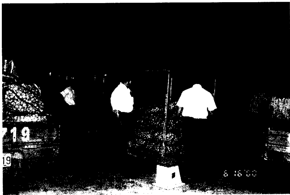
雲林縣政府聯手推出收購蒜頭策略，企圖提振蒜價

緊接著由縣府召集各蒜頭產地農會、合作社場共商研擬貨款收購蒜頭，並於89年6月15日~7月15日為期一個月的收購工作，此舉稱得上全台第一遭及破天荒的創舉，顯見相關單位捍衛蒜農的基本權益而打拚的精神。但由於收購