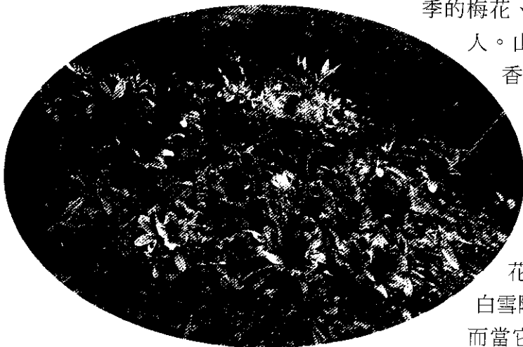
山坡上盛開的杜鵑花嬌艷動人