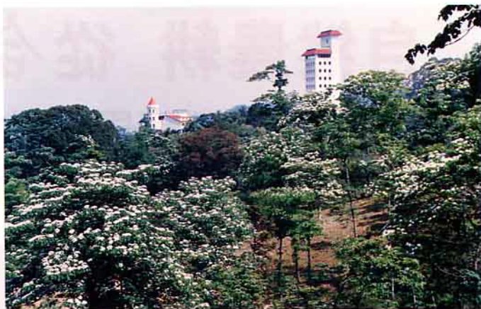
夏季的油桐花開滿山谷，像白雪般的附著於樹梢，美極了

東勢林場則隔絕光害，杜絕農藥污染、同時利用自然方式，種植甘藷葉，鋪稻草，製造腐草爛木環境培養有扁蝸牛和蚯蚓供螢火蟲幼蟲食用。也使螢火蟲在極自然且安全的生態環境下生存與繁殖。每年在4~9月間，就有上萬到數十萬隻以上甚至百萬隻不等的螢火蟲到