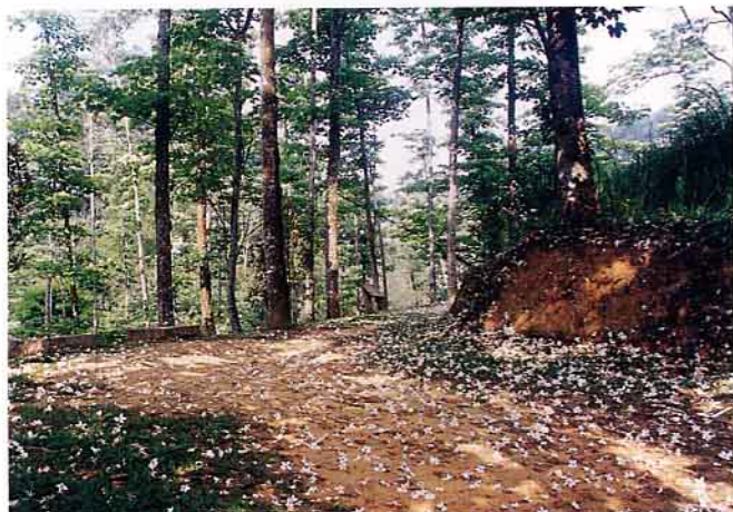
盛開的油桐花邊開邊落，像下雪般的鋪滿一地