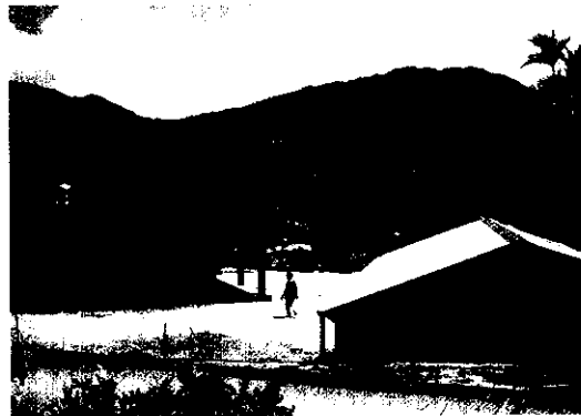
大竹村部落，整潔美麗