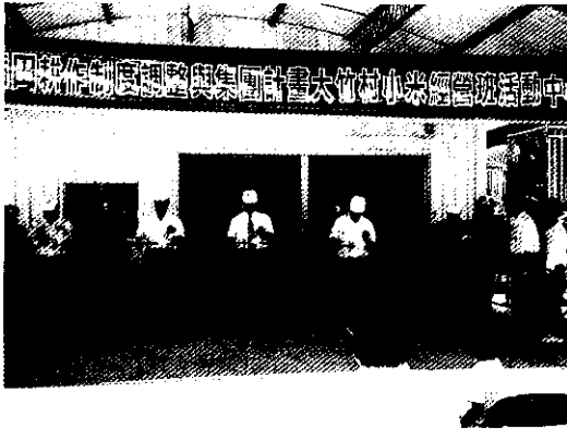
產銷班活動中心落成啟用，長官蒞臨剪綵