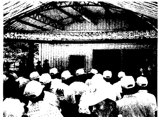
活動中心啟用儀式一角