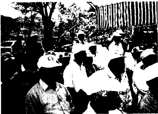
產銷班活動中心啓用，班員個個熱情參與