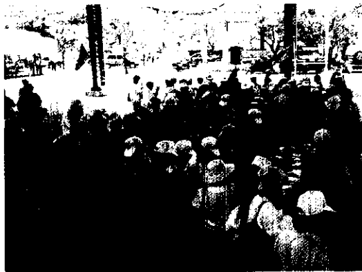
小米品嚐會上，表現出小城鎮的人情溫暖，充滿歡樂