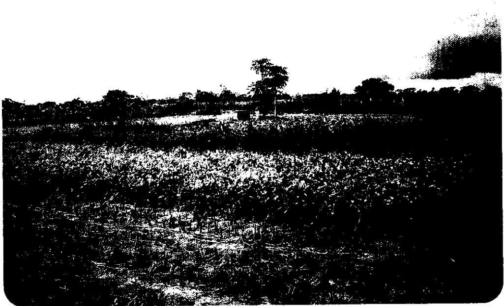
我駐甘比亞農技團輔導班竹町地區農家婦女將荒地墾植成爲綠油油的菜圃，所種植的蔬菜品質良好