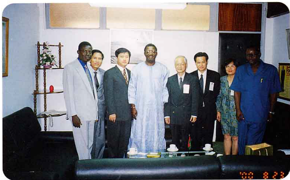
陳主任委員拜會布吉納法索農業部畢堅卡部長，洽談雙邊農技合作事宜