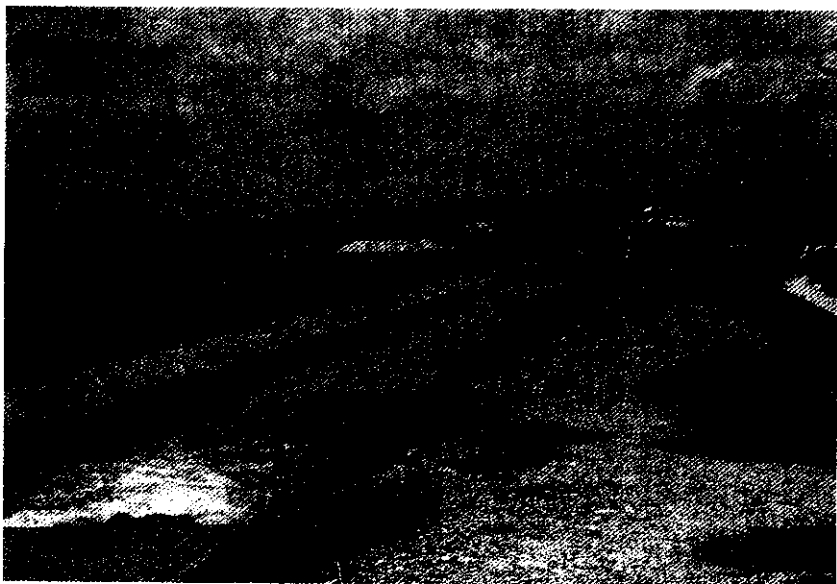
我駐布吉納法索農技團深入荒野，胼手胝足在巴格雷壟區規劃設置的水利設施，施工品質良好

台灣過去50年的經濟發展經驗，從早期的全力發展農業，中期的以農業培養工業，到後期的以工業扶植農業，進