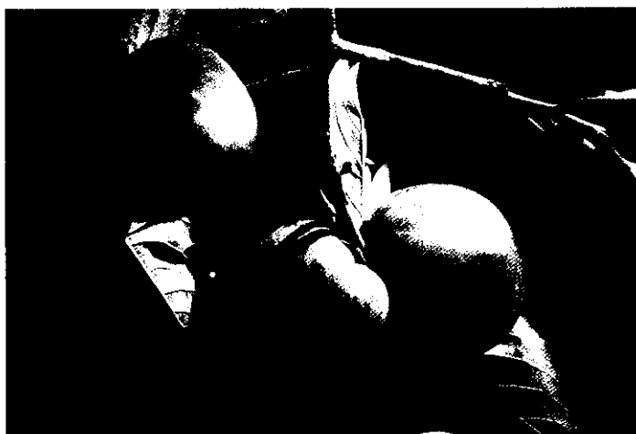
發展地區特產，甜柿將是一種適宜的水果

近年來由於國民生活水準提昇，消費習慣改變，由過去量的滿足演變到質的需求，傳統生活方式的改變，在食物