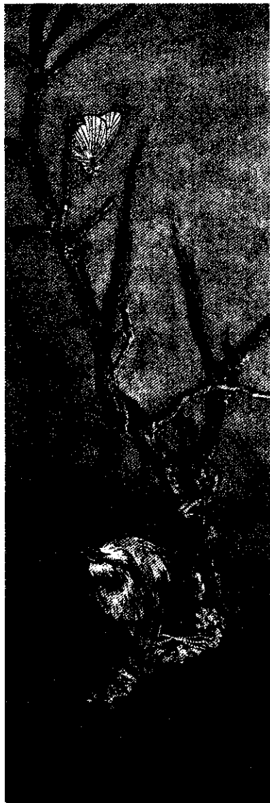
賴吉仁「倒」亦有道-茶腹 90x30cm 油彩 2000

島嶼精靈生態繪畫五人展 何華仁、徐偉、徐偉斌、鄭義郎、賴吉仁 2000/11/18(六)~12/3(日) 台北福華沙龍 台北市仁愛路三段160號2F