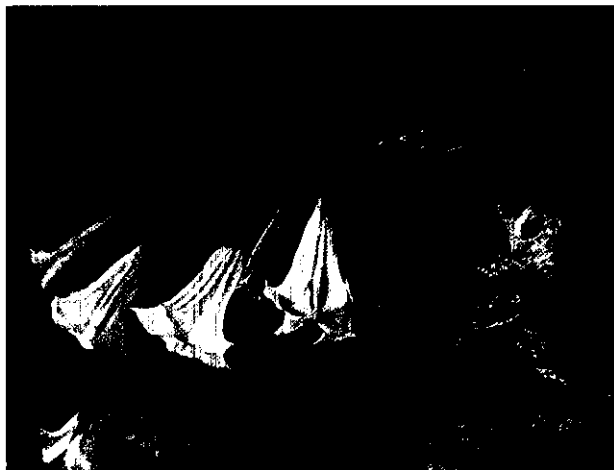
徐偉 領角鴉 54x75cm 壓克力顏料 2000