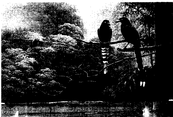
徐偉斌 台灣藍鵲 108x63cm 壓克力顏料 2000