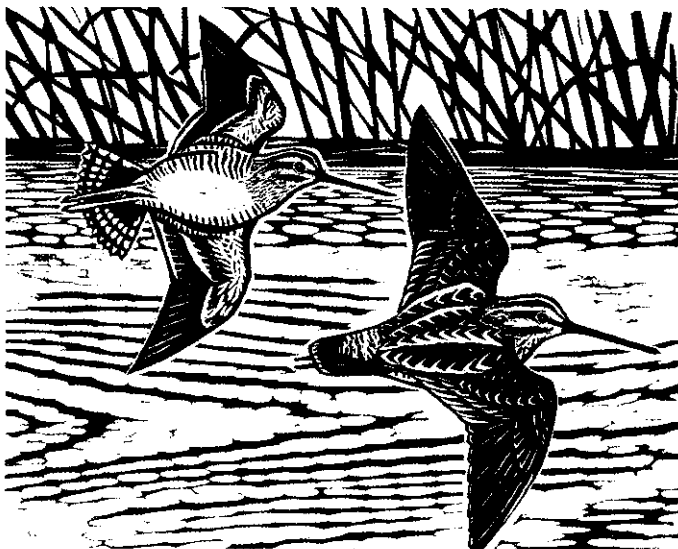
何華仁 田鵲 37x31cm 版畫