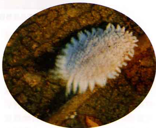
柑桔粉介殼蟲會分泌蜜露誘發煤病