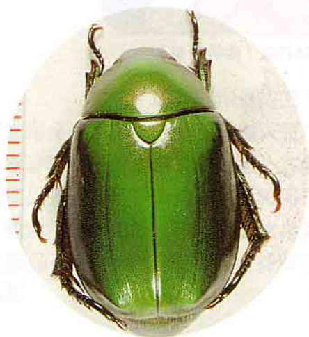
危害葡萄樹根部的害蟲-赤腳青銅金龜

在本省為害葡萄枝幹的害蟲有台灣白蟻，在樹勢不良情況下為害根莖部。咖啡木蠹蛾及黃斑蝙蝠蛾為害葡萄莖幹部及枝條，尤其在台中縣山坡地區，為害較嚴重。另外，中華姬天牛在葡萄樹皮和木質部間為害。棕櫚盾介殼蟲吸食