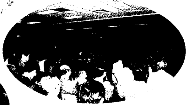
大里市農會新舊任總幹事交接典禮場面，賀客盈門，場面熱鬧