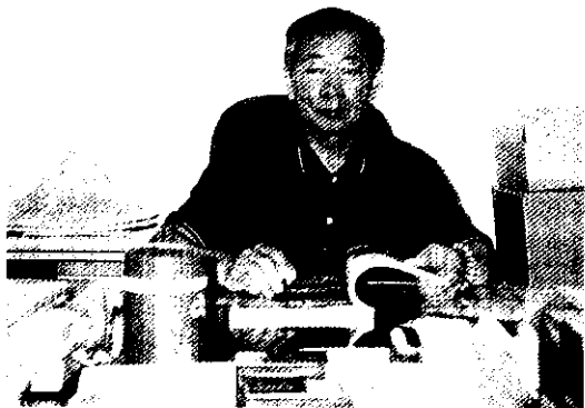
筆者請閱讀「台灣的農村奇蹟」的讀者，多予指正

當我接辦農業產銷班之組織運作輔導時，剛開始只有蔬菜與花卉，後來又加果樹等農業產銷班，尚能勝任愉快，兩年後，從85年開始擴充到了養豬、養牛、養鷄、養鴨，特用作物、雜糧、水稻等十多種產業的農業產銷班，那就沒有那麼簡單。在辦理產銷班的過程中，每年都有考評，考評過程中與台大農推系主任陳昭郎教授，請益指點，做個計畫把區內歷年的傑出農家經營成功的方法供農業產銷班輔導之參考，於是經過思考後擬定“台灣北部地區歷屆傑出農家成功之道調查彙集”，向中正農業科技社會公益基金會，申請贊助，從85年7月至88年6月為期三年，計畫經審查通過贊助時，一則喜、一則憂，有沒有能力完成這三年龐大的計畫。