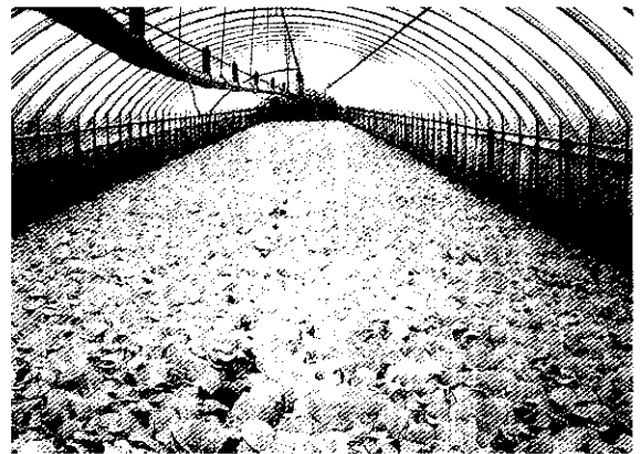
生產安全、清潔、健康蔬菜，使消費者吃出健康