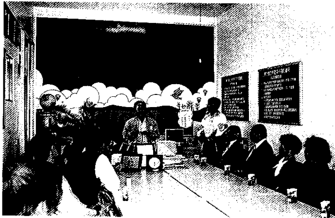
好產品，也要積極推銷

到了「青春期」大家對組織運作也漸成熟，但各有各的想法，班內不再允許權威式的領導，彼此也可能爲了小事理念或補助爭吵，這時儘可能培養一起工作一起決策的運作模式，彼此多共同作業，以培養