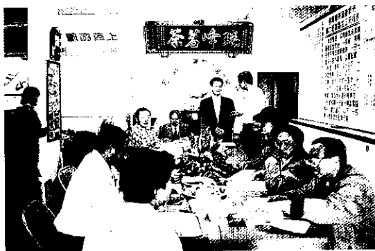
召開班會，集思廣義

下，猶如對對戀人參加了集團結婚成立了共同家庭，也選了大家長一班長、財務大臣一會計及內務大臣一書記，一時之間成家立業之賀聲四起，到處有新屋落成，也有開不盡的技術大會（班會），更有1年度的