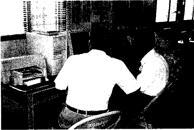
上網觀察市場行情，才能知己知彼