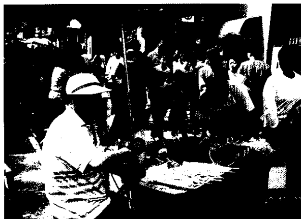
擺攤，自銷切片西瓜與哈密瓜的農民

中國地跨熱帶、亞熱帶、溫帶及寒帶氣候條件，適合各種果樹栽培生產，且果樹種質、種源豐富，勞力成本低，極具優勢。自1978年改革開放後，水果作物發展快速，年產量由650萬噸成長到1998年之5,400萬噸，20年來成長8.2倍，而每人每年水果消費量，由不到10公斤成長到42公斤。大陸水果種類及數量以北方之蘋果第一；南方之柑桔佔第二位；梨佔第三，其餘則為香蕉、桃、葡萄、荔枝、龍眼及一些次要水果。大陸為許多果樹之原始中心，種類、種源多，而中國跨熱帶、亞熱帶、溫帶、寒帶等氣候型，適合各類果樹發展，且農