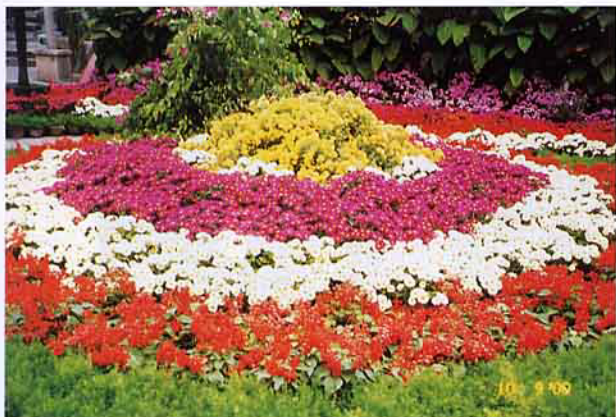
大陸花卉產業成長快速，台商投入影響很大。未來，值得注意的是蝴蝶蘭市場