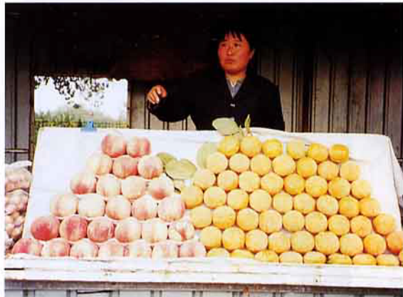
中國地跨各種氣候條件，適合各種果樹栽培，但分級包裝粗放，水果行銷仍處起步