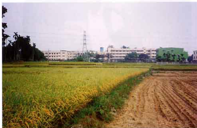
草屯鎮是個農業鄉鎮，農民種稻居多