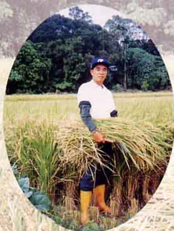
圖 / 草屯鎮農會 · 黃貴豪