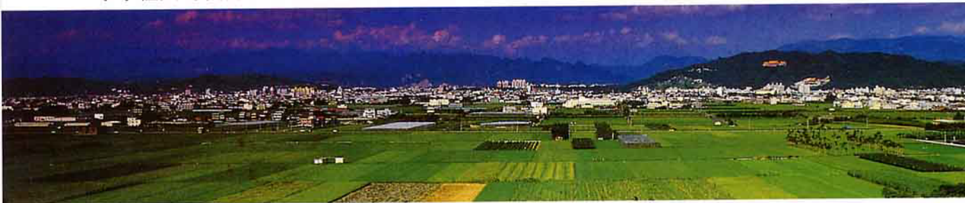
草屯鎮街景及田園風光