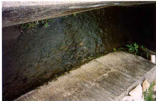
純淨、豐沛的水源，灌溉了草屯鎮5千多公頃的耕地面積