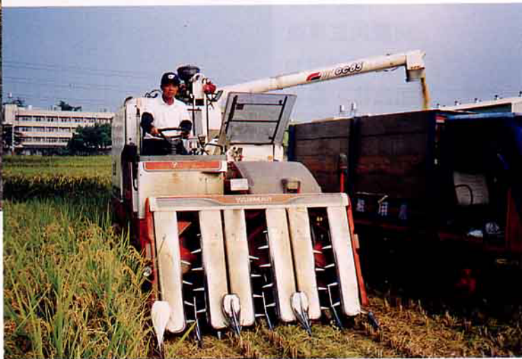
▲割好的稻子，直接裝車送到農會處理