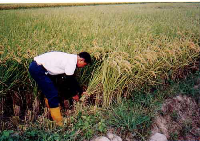
▲過去是這樣一束束的割稻，多辛苦