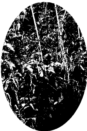
植株生病模樣（前右二）