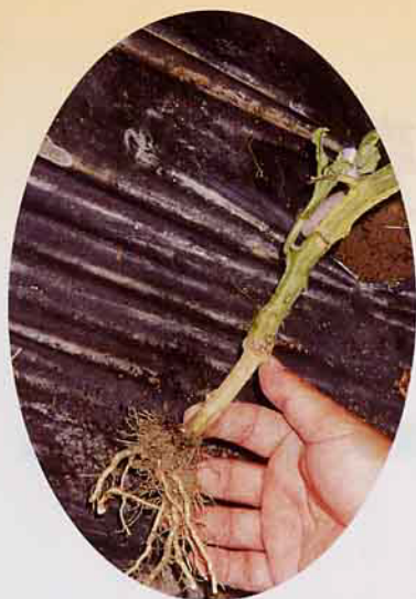
有些植株曾用抗青枯病的茄子做過砧木