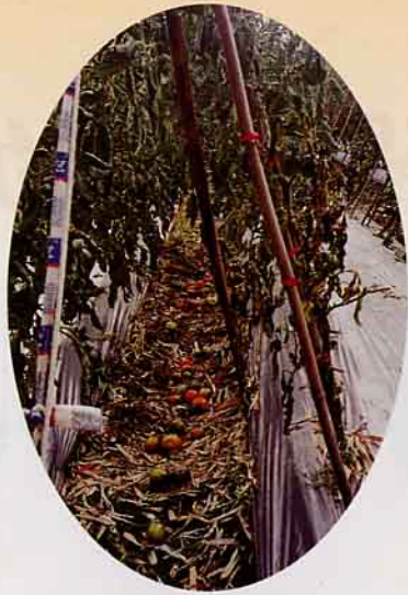
不合市場需求的番茄，都丟在田裡