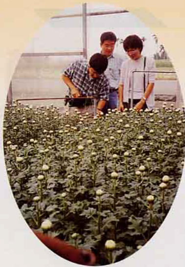
我覺得「一條龍」品種有「千山我獨行」氣質

木，有些則無，所以既是同時種植，植株也有高矮不同的表現。當然，園區中的確有不少植株是生病了，有些是整棵枯萎，有些是裂果，有些是葉片異常，怪不得農友會著急，輕專長生理、植病的同事會診，認為部份病癥的現象應該是施藥不當。