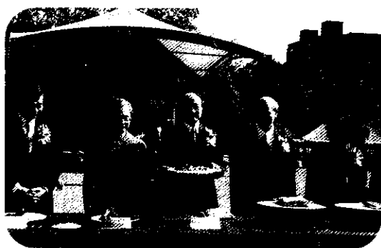
侯場長等貴賓向大家介紹每一道有機菜餚