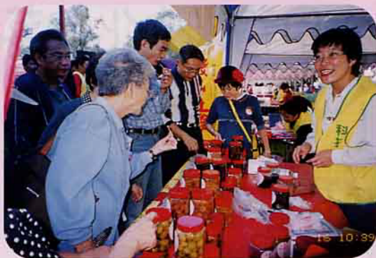
▼ 有機農產品展售會吸引台北市民踴躍採購