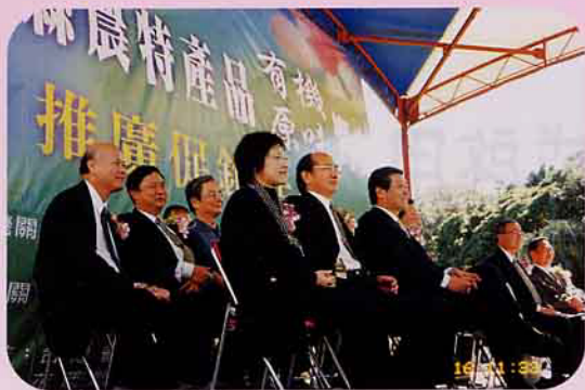
◀ 花蓮縣政府農業局杜局長等貴賓與會