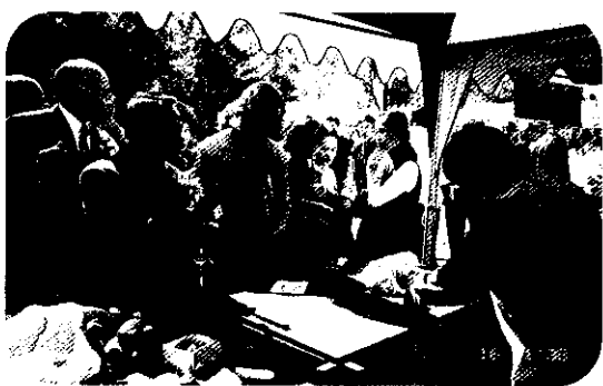
李副主委健全巡視各展售攤位