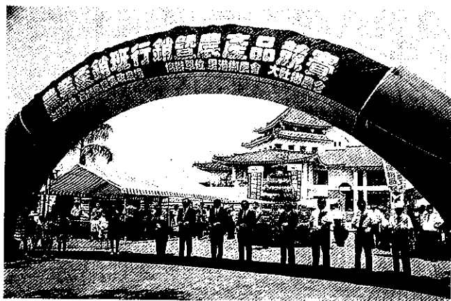
行銷競賽在鼓勵農友重視行銷