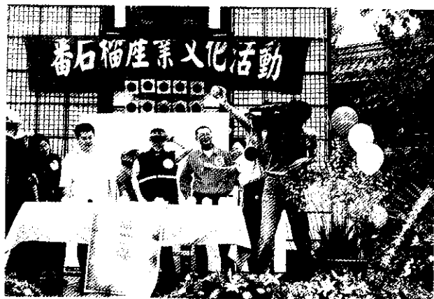
產業文化活動是精緻的行銷