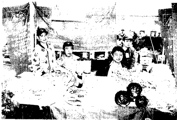
布條介紹也是一種行銷

可喜的是，近年來中壯年的農友，在推廣單位的積極教育下，對於農產品的行銷是比較有概念了，至少他們已經知道農產品也需要像工商產品一樣，從事行銷工作。甚至，少數班員還經常把「行銷」二個字掛在嘴邊，只可惜或許