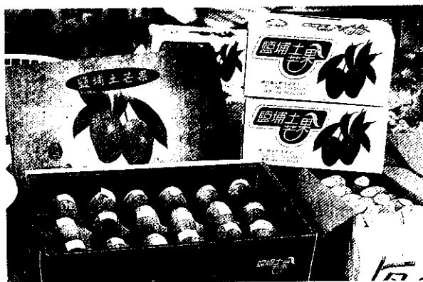
好的分級，配合行銷才能抓住消費者的心