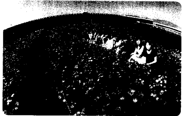
宜蘭好山好水，適合植物生長；今年花紅勝去年，歡迎作伙來宜蘭

2001宜蘭綠色博覽會即將在90年3月21日開始舉辦，為期39天。這場以生態、環保、自然與健康為主題，強調綠色生活與健康世紀的活動，地點位於全國最大的露營場區【宜蘭縣武荖坑風景區】，在這依山傍水、蟲鳴鳥語中舉辦全國最大的農業活動，以【百萬花海】點綴的會場中展出十大主題，【奧林匹克館】舉辦各種植物競賽，強調植物藝術與生活。【植物健康館】展示自然草藥，發揚神農百草的醫技。【蜂采館】介紹蜂的世界，強調蜂的數學生態。【影響台灣經濟十大植物館】展出國內重要農產品，強調古往今來協同台灣創造經濟奇蹟的植物。【綠色概念館】展出各種環保資材，強調永續觀念。【宜蘭館】展出各種蘭花，強調蘭花生活化的一面。【香精館】展出各種帶味植