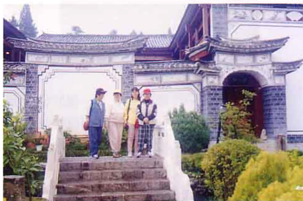
玉泉賓館古色古香

位開8人座箱型車的老板，約好次日上午9:00出發，沿石安公路～楚大高速公路直驅大理再上麗江（未建高速公路前為滇緬公路，至大理為344公理，過大理約一小時餘車程至麗江），夜宿麗江古色古香的至「玉泉賓館」（如附圖）。