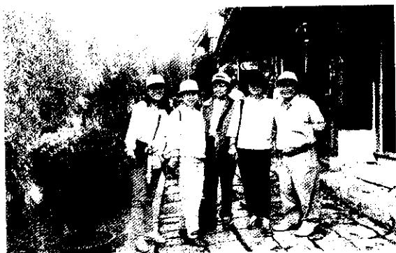
大理古城沿護城河，兩旁商店相連