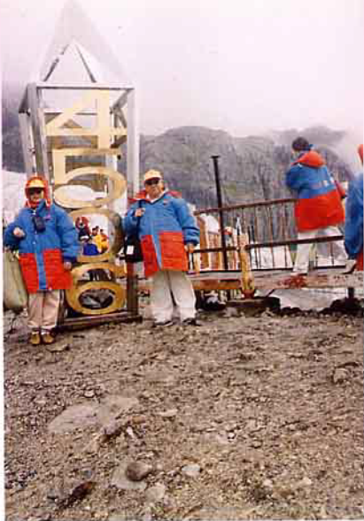
玉龍雪山海拔4,506公尺，後為億萬年不溶冰岩