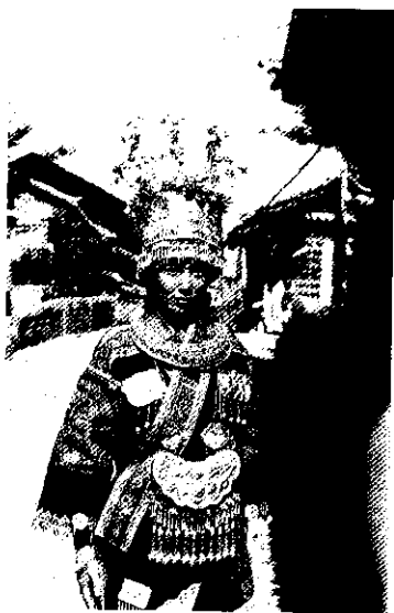
彝族女孩裝扮另有特色

→ 驕、武官下馬」的告示令人敬畏，以及其樓廓至今都保藏得很完整。（白、彝等族於明代在此拓衍、唐代建南詔國約738年前宋代建大理國，至段正元段譽第11代國王為元朝所滅）。