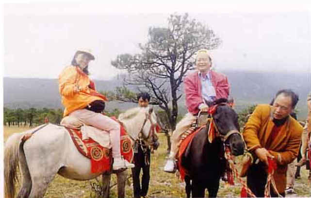
在與馬商談妥價錢後即可任君放馬奔馳黃花草原

附圖）；正在這時，卻見到幾條生龍活虎似的豐齡綿羊蹦躍於山巔之間，帶給人不少鼓勵，不過這些甜姊的手上卻總是離不開枕頭，直到吸光氧袋才肯依依離開雪山。回到山下，車行未久，我看到黃澄澄小花一片的草原，一時手癢請司機暫停一下拍照，結果引來一群兜銷馭馬的商侶，談攏價錢後，大家自然就在形同塞外的空曠草原上盡情躍馬，活絡一下筋骨，真叫「疲意全消」（如附圖）。傍晚我們途經麗江回到大理，遠遠的就看到燈火通明的大理三塔夜景，