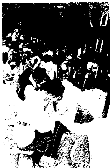
當地金花女郎每日裝扮入時，成群集聚遊樂區路旁針紮織染布類，十分忙碌

(3)著名的崇聖寺及三塔建於南詔時期，歷史悠久，主塔「千尋塔」，高69.13米，共16級，（密檐式空心磚塔），南北兩塔高42.19米，各10級。現時古廟已毀（修建后似叫天龍寺）三塔年久均已略顯傾斜（如圖），夜間燈火通明更顯巍莪。據云三塔於1978年維修