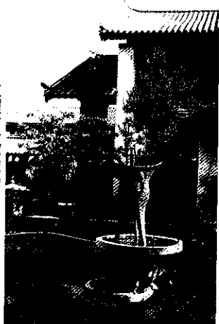
大理古城處處充滿詩情畫意

洱海月：淡水湖泊、清水映月、景色令人沉醉。曾有當地謠歌如下：『下關風、上關花，下關風吹上關花；蒼山雪、洱海月，蒼山雪映洱海月』另有當地的金花服飾也有風花雪月的噱頭：耳鐙予搖恍表下關風、掛紅花背結蝴蝶代表著花團簇錦、包頭雪白表白雪、狀似滿月映暉，就不言而喻其為「月」字當頭了。