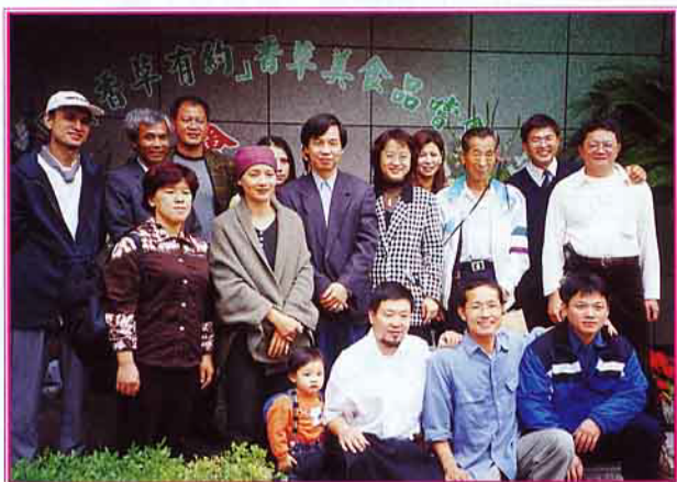
▼ 籌組中的「香草家族」聯盟會員們