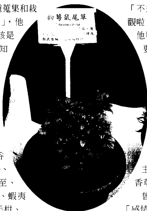
粉萼鼠尾草 也是香草一種

其實多少了解「香草」的人都知道，其主要原因是這些香草原產地，大部份在溫帶國家，所以移到亞熱帶氣候的台灣栽培，當然就會熱昏熱死嘛，尤其農業研究機關做這方面研究的人員不算多，能給的諮詢當然就少。