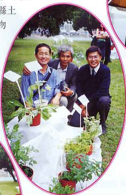
◀ 與「香草家族」聯盟籌備會長尤次雄兄弟倆（右一、二）有志一同