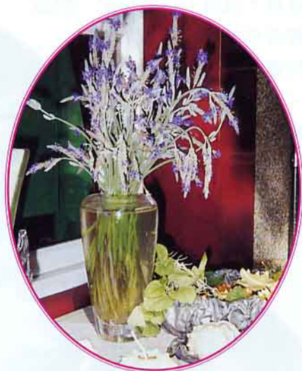
◀ 瓶插薰衣草不缺浪漫