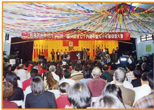
植樹節紀念大會現場