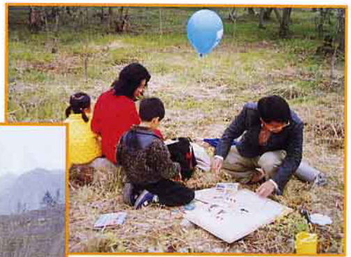
植樹節活動之一～繪畫比賽