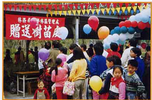
贈送樹苗，大家來種樹