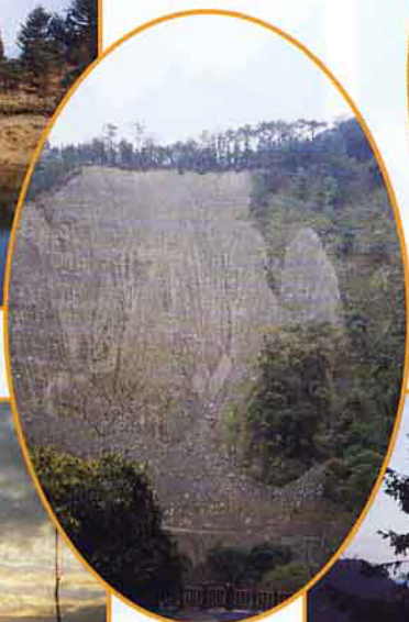
經過震災， 青山裸露正 待復建