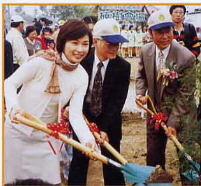
農委會陳主委(中)與林務局黃代理局長(右)一起植樹