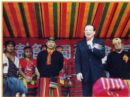
張院長蒞臨植樹節紀念大會現場

今年全國紀念國父逝世76週年暨90年植樹節大會於3月10日在林務局東勢林區管理處(舊址)大禮堂舉行。據林務局表示,今年特別將90年植樹節大會及紀念活動安排在東勢舉行,除達到綠化目的外,同時也為「921」震災重建區帶來新的面貌,加速重建腳步。大會會場~東勢林區管理處(舊址)也因「921」大地震受創嚴