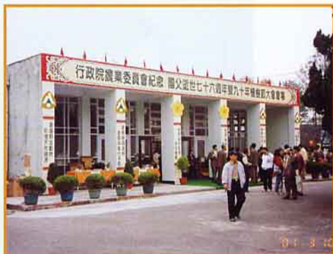
大會活動現址,日後將規劃為森林公園