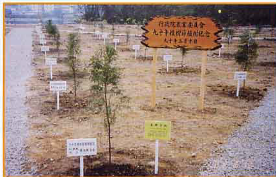
長官與民衆一起栽植的樹種