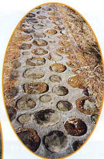
大 雪 山 的 步 道 ， 很 特 別