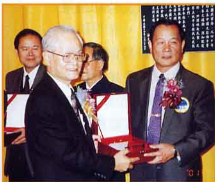
農委會陳主委頒獎給林業有功人員

今年全國紀念國父逝世76週年暨90年植樹節大會於3月10日在林務局東勢林區管理處(舊址)大禮堂舉行。據林務局表示,今年特別將90年植樹節大會及紀念活動安排在東勢舉行,除達到綠化目的外,同時也為「921」震災重建區帶來新的面貌,加速重建腳步。大會會場~東勢林區管理處(舊址)也因「921」大地震受創嚴