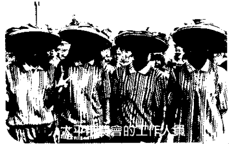
太平市農會的工作人員