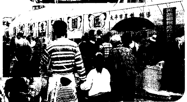
▲配合嘉年華會的蝴蝶生態園區