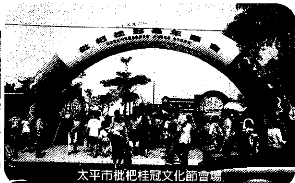
太平市枇杷桂冠文化節會場