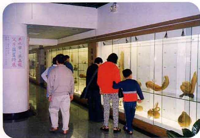
展出內容豐富又饒富趣味性、參觀民眾絡繹不絕

葫蘆家族，是吳先生的傑作，大小葫蘆做出不同造型，除了人物，還有動物，在各次展出中時常會引致一些有趣的事情，有次在台中展覽時，有一對夫妻還因有一個雕刻成西瓜模樣的葫蘆瓜，一個說是西瓜，一個說是葫蘆而吵了起來；還有人當場問吳先生，說西瓜放那麼久為什麼還不會壞掉。吳先生不但能雕刻葫蘆，還有乾燥花製作的本事，將乾燥西瓜葉及西瓜藤搭配，和真的西瓜很相像，還有在一個不到3公分大小的葫蘆上刻了一百多個字的微雕心