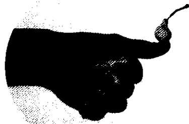
號稱最小的葫蘆瓜