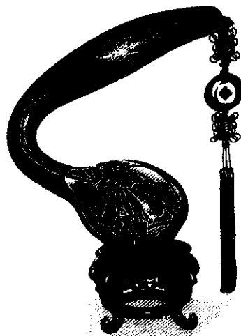
這件葫蘆雕飾作品已有20多年歷史