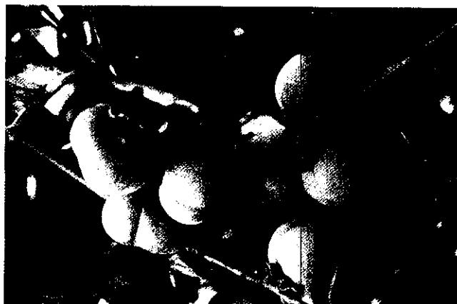
枝頭結實累累的柿子