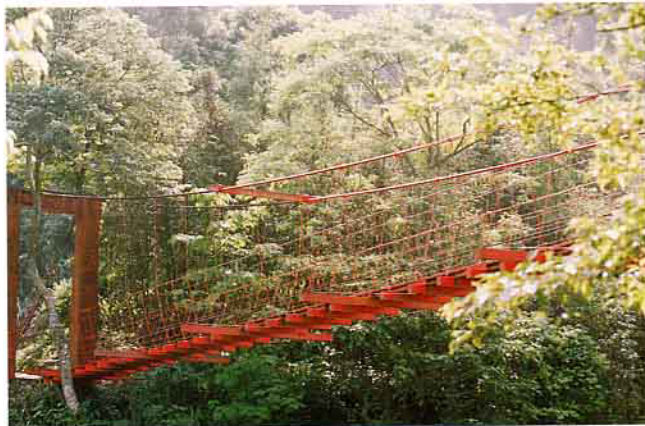
走過時光隧道的索橋