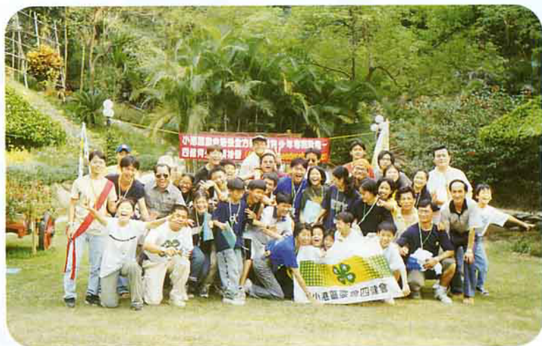
參加「領袖營」，但並不一定每人將來都適合當領袖

齡層普遍的降低，所以我們針對此做了調整，改朝以帶團康的技巧、和舞蹈教學及分站學習為方向，增加他們在這些領域的知識及領導能力，不只學員們需要學習，我覺得隊輔甚至更需要，因為他們是在領導將來也要領導其他人的，所以大家都要一起來擴充自己的學識、知識及思考能力。