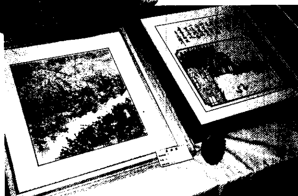
壓花~四健會員的傑作