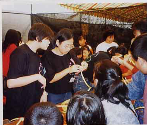
只要肯學，就會做得好