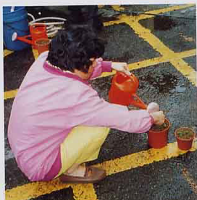
栽種小樹苗，除了常澆水，還得時時關懷它