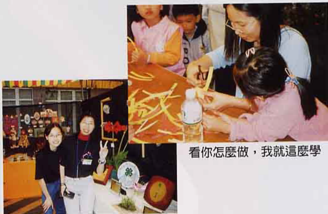
看你怎麼做，我就這麼學