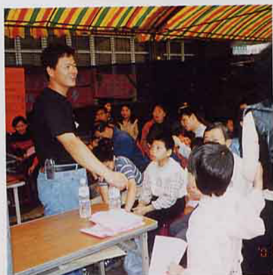
聽大哥哥解說，如何種花？