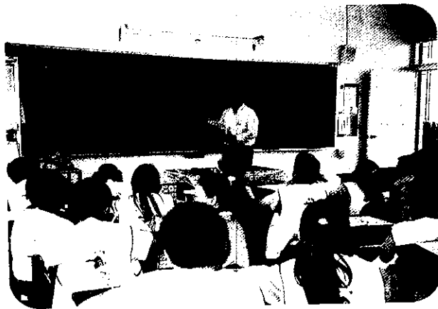
由四健會義指黃老師講解花卉栽培之方法