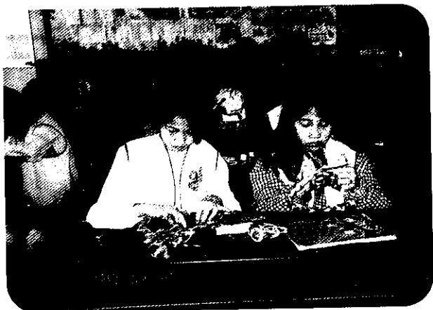
四健會員製作手工藝作業組之實況