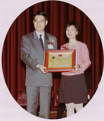
陳副主委頒獎給四位得獎人