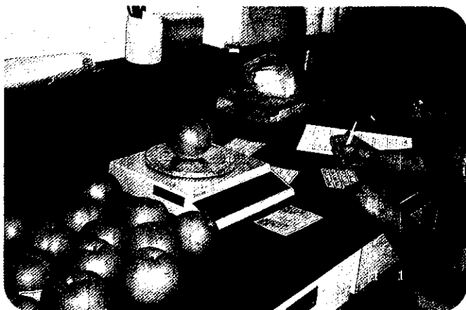
高接梨果實性狀調查

高接梨果園土質經分析pH4.43~5.69，屬酸性土壤，有機質含量屬於低、中等級。有效性磷表土、底土均屬於高等級，鉀含量屬於高等級，鎂含量示範區表、底土屬於高等級，對照區表土屬於高等級，底土屬於中等級，鈣的含量屬於中、高等級。並於4月中旬採短果枝新成熟葉（第3片葉），約100片 →