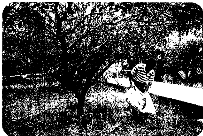
高接梨園有機施肥