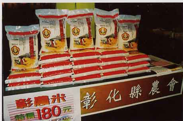
彰化縣農會提供彰農米促銷