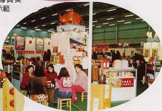
農業館佈置充滿本土文化風情