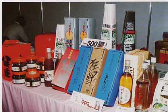
農特產品精緻的設計包裝