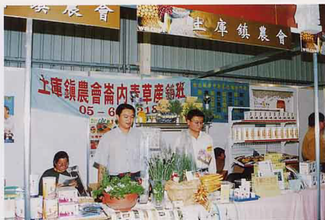
土庫鎮青草產銷班提供各種青草展示

匯 集全國美食於一堂，呈現多彩繽紛佳餚，香味四溢，讓人垂涎欲滴，及飽嘗口福。「台灣美食文化藝術」的活動，帶給了中部地區民眾除了視野享受，嚐盡天下美味，更為未來農產品的促銷拓展更寬廣的路，開放異彩。