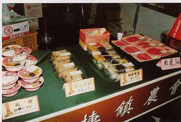
梧棲鎮農會鄉點米食