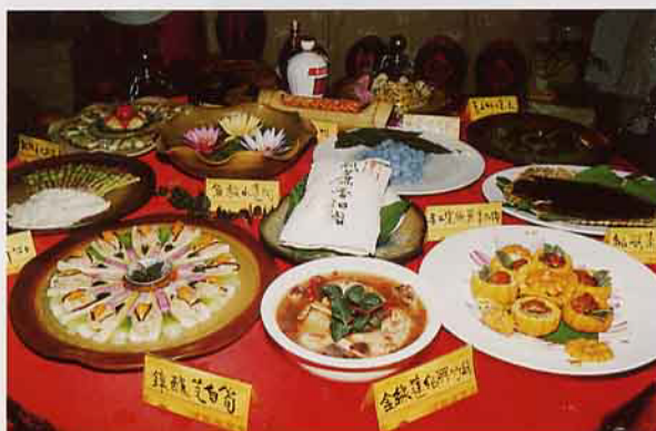
金線蓮等美味大餐