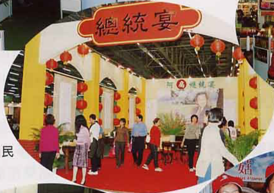
「總統宴」吸引民衆的參觀踴躍