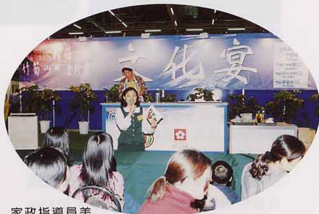
家政指導員美食教學示範

這次美食展，由於主辦單位收取門票150元，也因此，有一部份的民眾抱著既來之，爲了「值回票價」而呷到飽的心理，在試吃攤位則猛吃，未顧吃相，誠爲會場美中不足。