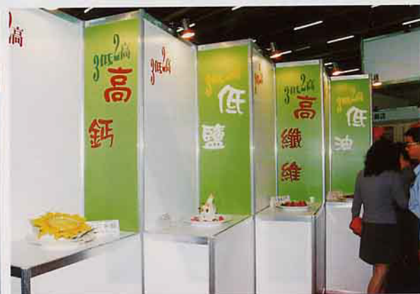
「三低二高」飲食新主張

小菜，像碗粿，芋薯粿，虱目魚，貢丸湯，豆腐，八寶粥等等，民衆可以感受一下全新的台灣美食。