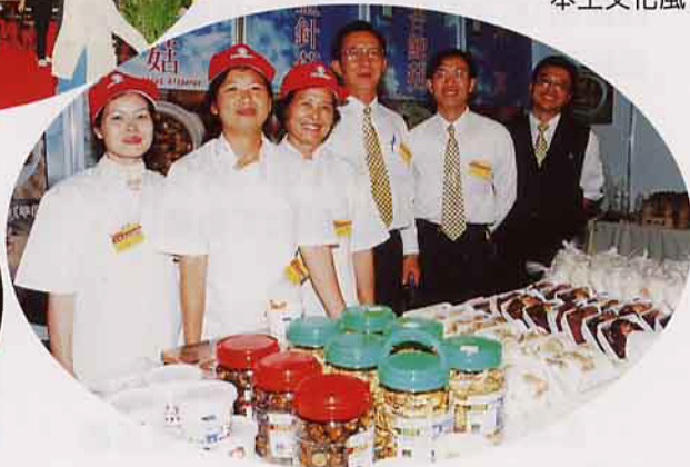
霧峰鄉農會提供菇類展示