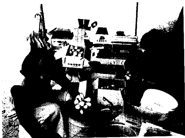
「枇杷人家」搭「常民文化列車」擺攤「自產自銷增加農友收益」