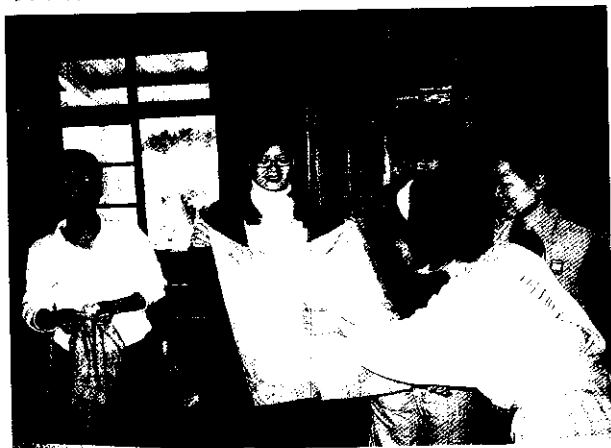
在「藝術公社」推出「枇杷染」創造枇杷葉、枝的附加價值