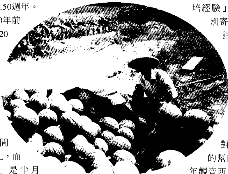
87年蕙寶無子西瓜採收