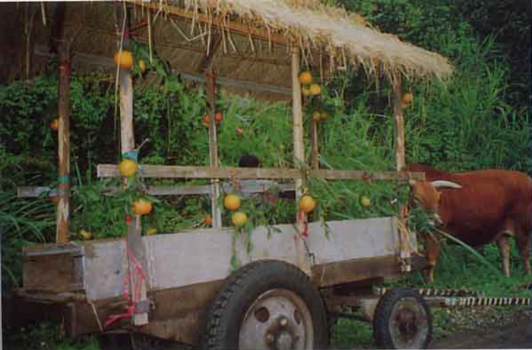
峨眉鄉「湖光山色桶柑鄉」產業文化系列活動之「古牛車田園巡禮」在十二寮休閒農業區穿梭往返，饒有情趣