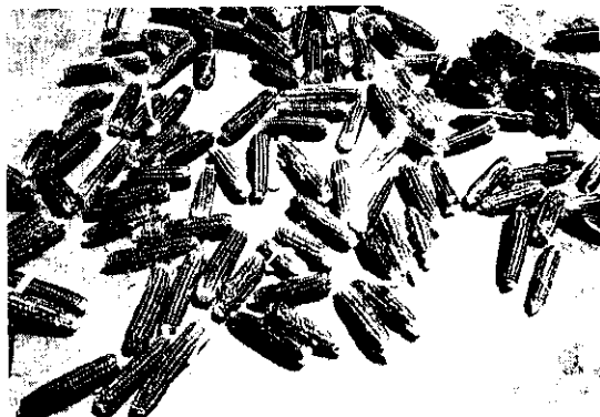
紫玉米日曬，粒粒十分亮麗

苗栗縣後龍鎮的特產「紫玉米」，不但外形亮麗可作裝飾品，而且甜度高，味道鮮美，已成桃竹苗地區市場新寵。