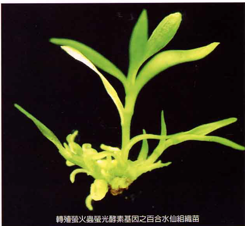
轉殖螢火蟲螢光酵素基因之百合水仙組織苗