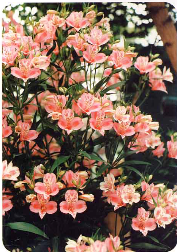
經過改良後的百合水仙品種

說，是將特殊的基因（例如植物的抗病性、抗蟲性等），透過生物技術手段（例如農桿菌、電穿孔、或基因槍等等），轉移到植物身上去，使其特性表達出來，以達到品種改良的目的。