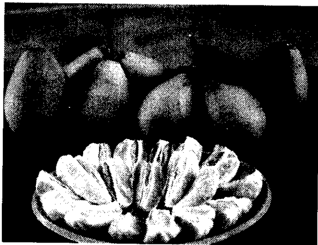
美味可口文旦佳果