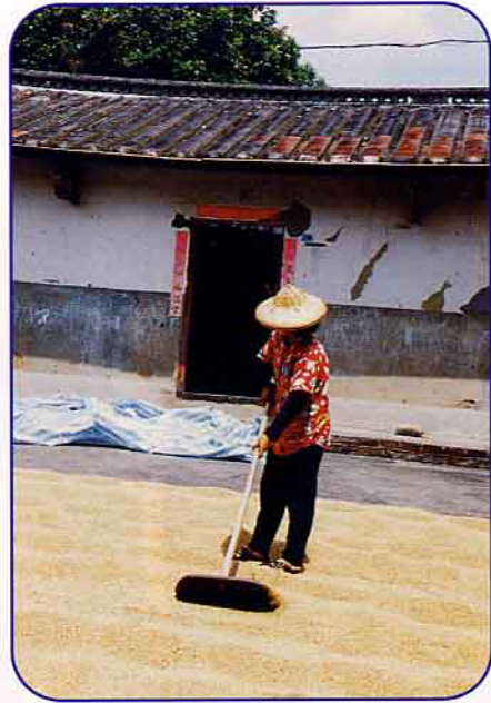
在門口庭院晒稻谷

繳地租： 通常雇用力壯的牛車工，如日據時代我家要背布袋粃，經過鐵路到公路，再用牛車運到農會糧倉，牽牛車的人力氣要強壯，一包1百多斤要背好幾趟，所以古早人說，粒粒皆辛苦，一粥一飯來處不易，要珍惜。