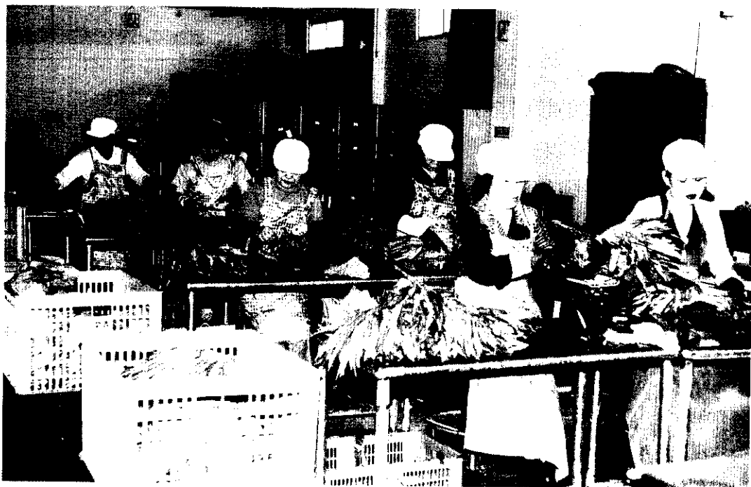
分級員一字排開挑選貨品分級清楚

最近幾個月來，農友經常抱怨景氣最不好，市場買氣欠佳，所以農產品價格大多賣得不理想。