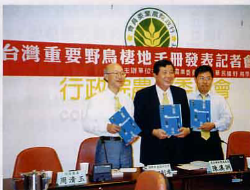
台灣重要野鳥棲地手冊正式發行

在行政院農業委員會補助下，中華民國野鳥學會依照國際標準在台灣及外島界定出53個重要野鳥棲地（簡稱IBA），並於