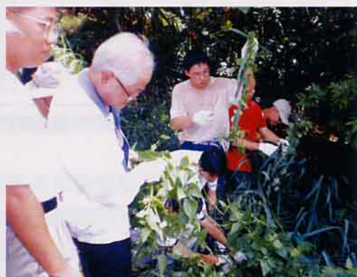
陳主委視察蔓澤蘭危害情形

完成「台灣重要野鳥棲地手冊」，由農委會林業處長陳溪州、中華民國野鳥學會理事長廖世卿及國際鳥盟亞洲主席市田則孝共同主持，於今(90)年9月3日在農委會舉行記者會，公開對外宣佈。他們也呼籲社會各界共同保護這些野鳥的重要棲息環境。