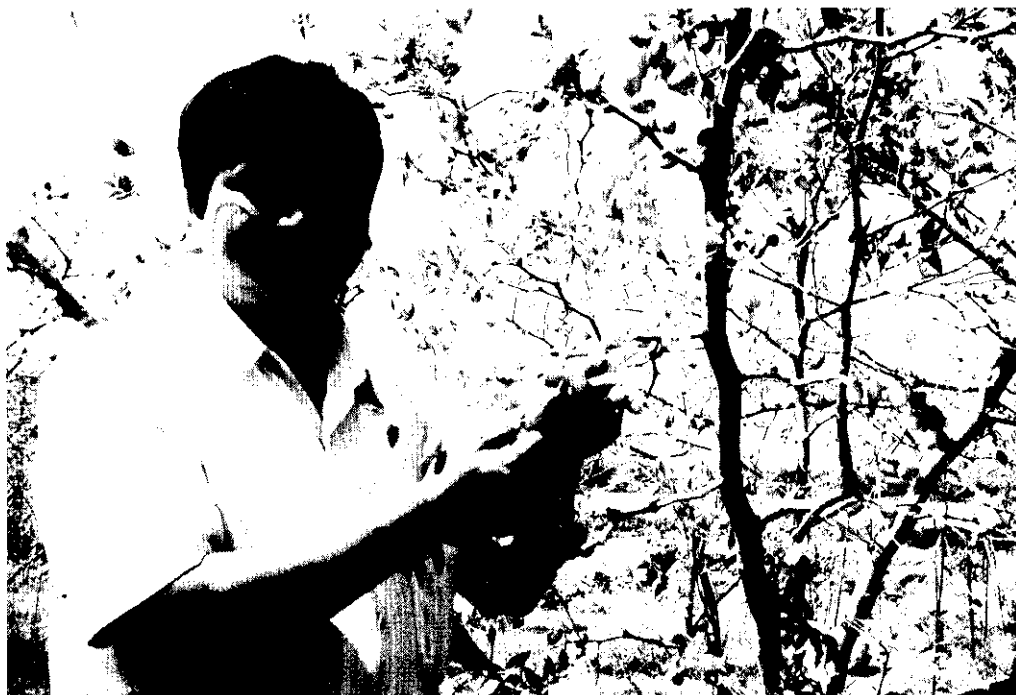
遊客自採享田園樂