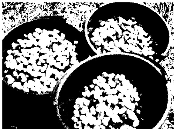
採下的紅棗像小橄欖狀十分討喜好吃