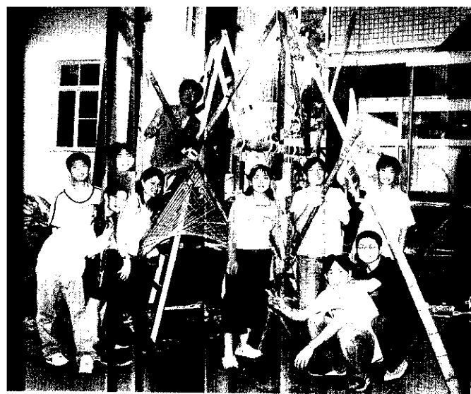
四健會員自我培訓，準備服務鄉內