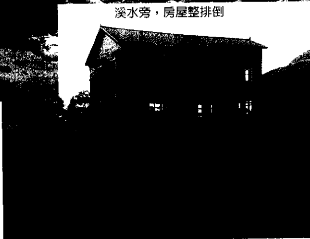
內湖村“溪坪”地區所有房屋10幾戶均淹埋，僅剩1戶樓房

歷經幾次的大浩劫，有時候覺得人能夠活著就真的該惜福了，但是如果能夠結合鄉民的力量，使大家都活的有意 →