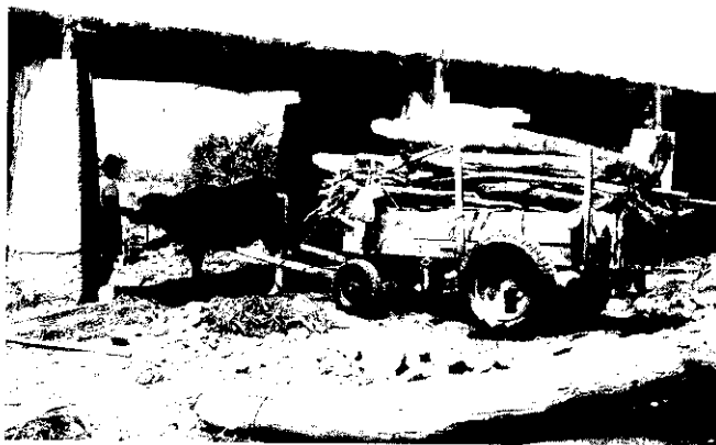
撿水流木滿載而歸

家庭生活品質提高，家庭燃料改用天然氣或電化製品後，河川上的這些水流木，除了上品的檜木材外，其他雜木再也無人問津，任其風吹日晒雨淋腐朽，讓人有暴殄天物的感慨！