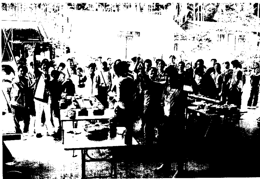
每個會員對自己的家鄉都充滿希望

有時候覺得人只不過是生活在感覺裡，只要夠溫飽，其實生活也可以很簡單。當您看到高樓大廈、良田美景一夕之間化為烏有，生離死別僅一線之隔，真是讓人觸目驚心，不勝唏噓，而災難已成事實，再多的感傷都是多餘的，未來的日子應該還可築出美麗的夢吧！由於『桃芝』颱風將鳳凰山內的隆田社區