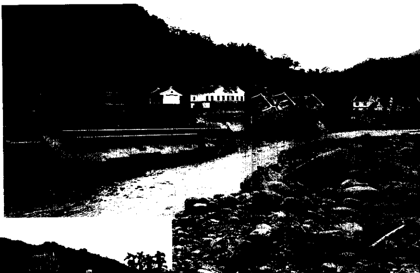
溪水旁，房屋整排倒

得面對『桃芝』颱風的洗禮，眼見不到一個小時的光影，『桃芝』颱風已將鹿谷鄉所有的河床都改道，河水氾濫成災，東、西、南、北所有連外橋樑都中斷，使得原來美麗的世外桃源，頓然成為孤島，有些村落更是大孤島中的小孤島，幾乎是成為獨立的村莊，村與村之間亦無法連繫上。眼看農田、村落變成河床，瞧老農們一付茫然的眼神，似乎無語問蒼天，他們的希望在那裡？