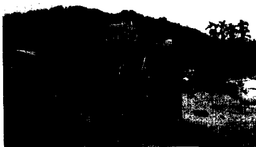
桃芝颱風帶來的浩劫