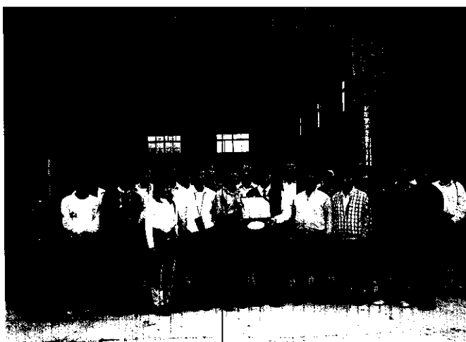
台大受訓推廣人員蒞臨本班參觀後合影