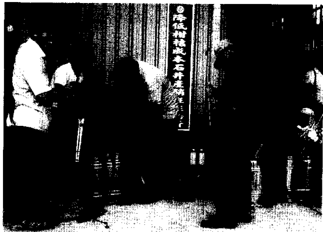
大夥兒一齊換工幹活

與柑桔的品質，在民國80年11月正式成立研究班，成立之初計有班員14人，經營面積32.5公頃。