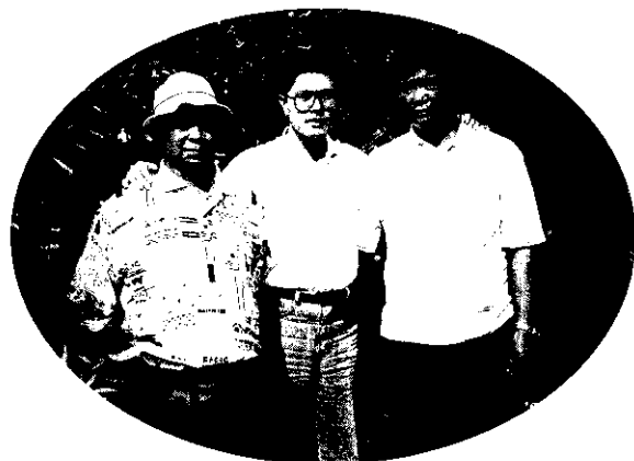
班長（中間）與班員在柑桔園合影