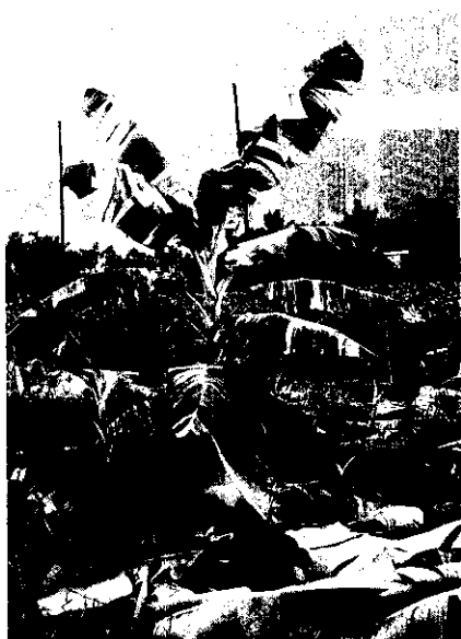
圖7 成長植株葉片維持綠白相間條紋

香蕉。在屏東高樹鄉便發現這樣的植株。在株高與其他蕉株一樣的植株，其果軸特別伸長，以至其果房及雄花穗幾乎接近地面（圖10）。除香蕉外，在台灣各地都有紅皮蕉分散種植。紅皮蕉有一特性，在新生的蕉株，有時失去原來的紅色，變為青綠色，我們稱之為青皮蕉。但在台中草屯，農試所溫英杰博士發現一株紅皮蕉，其果房一半是紅色，一半是綠色（圖11），你說奇妙不奇妙？