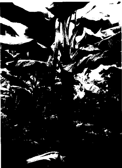
圖10 長長果軸，不用梯子，便可套袋