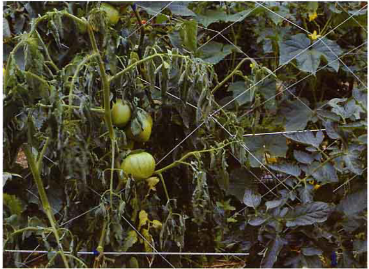
不要將同為青枯病菌之寄主植物種在一起，以避免互相感染

筆者調查中部地區蕹菜田土中青枯病菌之含菌量，發現曾發生過青枯病之田土中含菌量在 10^4 ~ 10^7 之間，因此建議若能換一塊新的乾淨田，所謂乾淨田