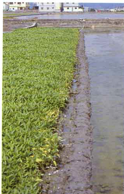
若將蕹菜田規劃為小田區較方便採收與放水管理

蕹菜青枯病篩選尚未發現極抗的品種可供農民使用，但有部份中抗品種，或可供農民參考以降低損失，而筆者將繼續尋找較適當的抗病品種。但各地栽培蕹菜所需求的園藝性狀差異頗大，因此建議農民可自行留意，積極尋找適合當地市場需求，且較原有品種抗病的蕹菜品種來種植，雖然病害同樣會發生，但發生比率降低，損失