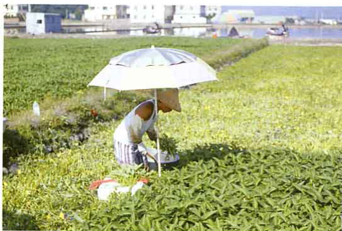
單靠藥劑很難防治青枯病，不但容易影響蕹菜品質、造成藥害，更為害水質