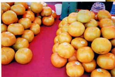
外表剔透，甜脆可口的高山甜柿

范班長接受採訪，娓娓訴說種植甜柿的心路歷程，他說：在幾年前，隻身不辭迢迢千里遠赴日本，拜師學藝栽植甜柿，他覺得