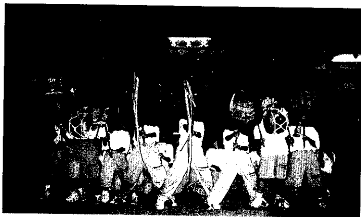
跳鼓陣作業組夜間集訓

號至5號。目前推出1、2號與民眾分享，其特質果肉厚、味道鮮美，免費贈送民眾試種。當天數量有限，每人領取2粒種子，送完為止，四健會員們身心手腦並用開創農業新氣象，也讓青少年體驗更豐富農村生活。