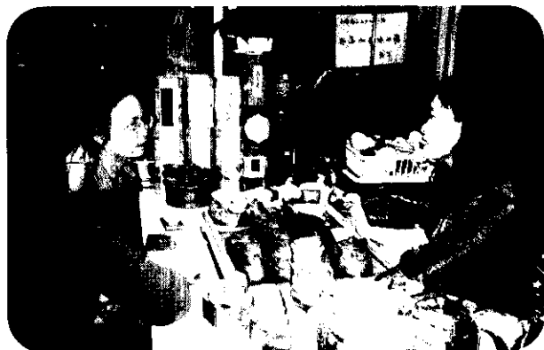
小姐們也嗜愛「品茗」——飲茶

據說在地球上總人口中，大約有二分之一的人飲茶，飲茶不僅是以營養爲目的，而且是爲了滿足自己的嗜好。茶不僅可作爲飲料，而且可以同其他食品原料一起使用，做成「吃」的食品。現在台灣，用於做食品原料和烹調原料的