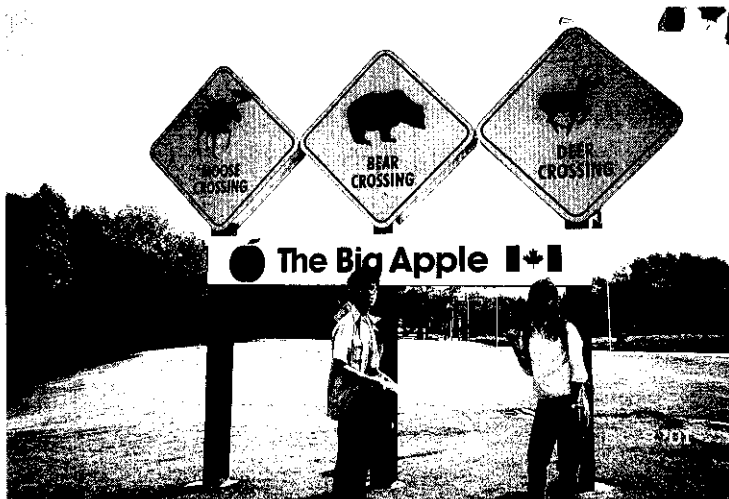
留心麋鹿、熊、鹿等圖案，在進入加拿大國境，隨處可見