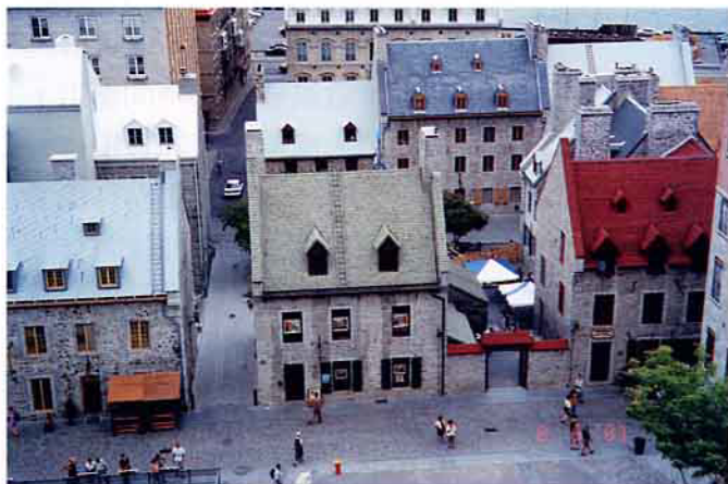
從魁北克「上城」看「下城」，房舍似圖畫

據導遊說，這兩個地方入了深秋，整個地區的景色只剩兩大色系，那就是紅和黃，這是楓樹的傑作；「那種美，是美到你會去相信人間有仙境」，我想她的形容詞不過「火」，因為舉目所見，楓樹在這裡是滿坑滿谷的蔓延，在峽谷中，白玉似的瀑布隨著人行步道，越走進峽谷越是漪旎，同時整個賞景點