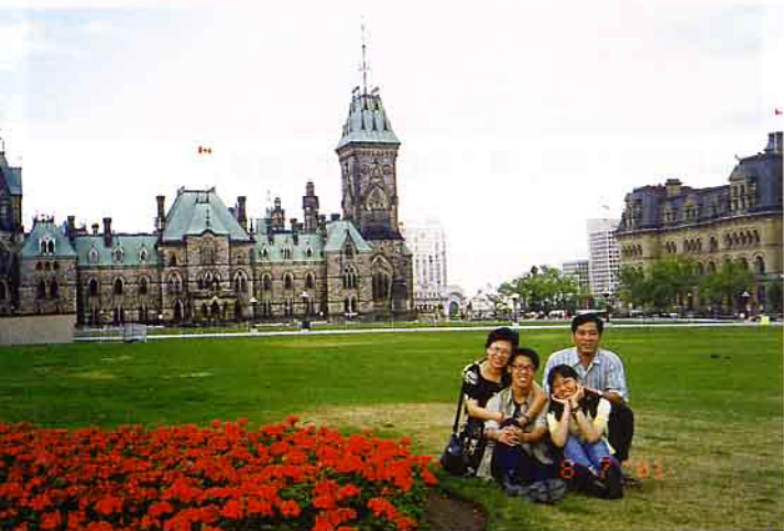
位於渥太華市的國會大廈，是棟風韻猶存的大樓

我們進到魁北克古城是下午4點20分，由於這裡的緯度高，又有夏令時間，所以並無「近黃昏」的時間壓力，唯導遊也只能給大家兩小時的自由行，我們一家4口不知怎樣的，都沒有搞清楚，除了流覽「上城」，尚有時間可去到「下城」，所以錯過了遊「下城」機