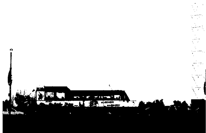
渥太華市的「鴨子船」(Ducks)是水陸兩用