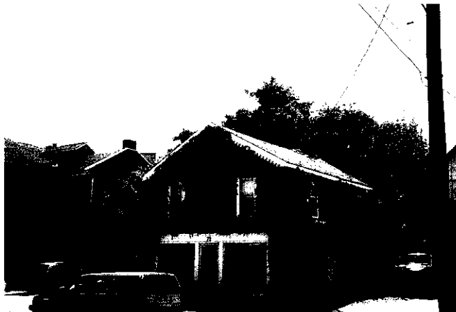
穿著綠色植物衣裳的商店