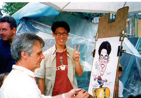
◀ 選擇了一位法國畫家，畫一張卡通造型人像畫