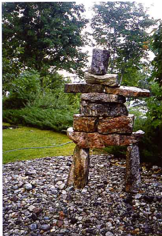
位於加拿大首都渥太華的總督府，有愛斯基摩人推石