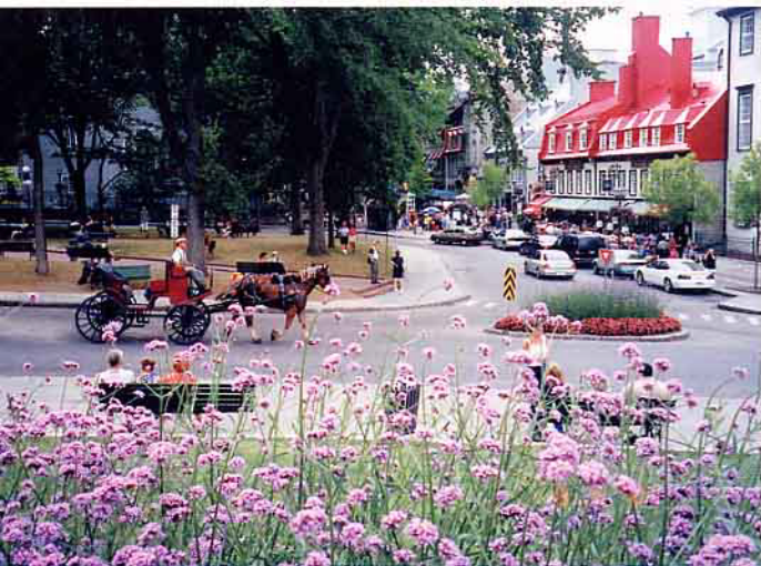
魁北克市是保有舊圍牆的古城

至於那些以紫色和黃色為多數的野花野草，也是可愛，我在想，目前台灣的休耕農田，夏季裡大都種田菁也不是