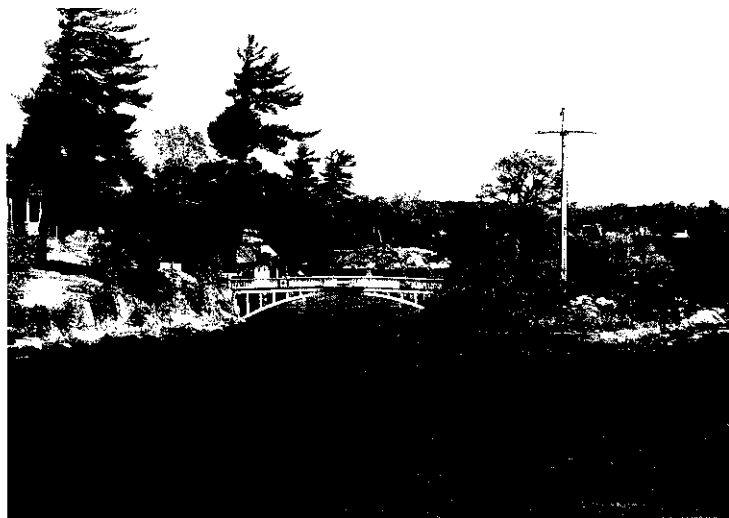
千島群島有世界最短的國界橋

玻璃窗，可讓路人清楚看到一艘載有印第安人的獨木舟，落落大方的從天花板吊著下來，從博物館再走10幾分鐘，又可到達渥太河岸邊。