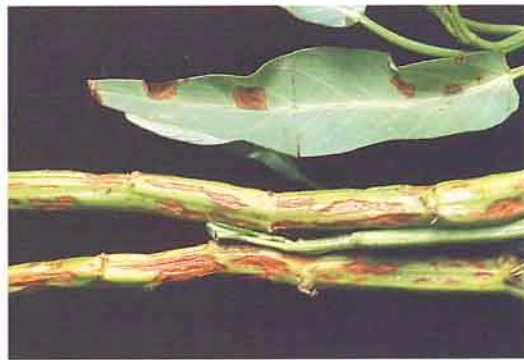
葉斑病：莖及葉片病徵

斑點，無經濟價值可言，由於罹病葉片伴隨乙烯的產生，因此常見病斑周緣出現黃化現象，嚴重時整個葉片黃化乾枯。發生嚴重的地區，葉柄及莖部也會形成邊緣不整型或長橢圓形的壞疽斑。